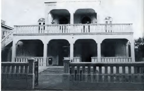
ONDERWIJSZAKEN: het toekomstige Departement van Onderwijs voor Aruba.

Na de drie Stichtingen voor bijzonder onderwijs op bovenvermelde wijze op een rij gezet te hebben, zou een conclusie getrokken moeten kunnen worden of deze in de bestaande situatie ook werkelijk functioneren zou betreffen het doel waarvoor de Stichtingen zijn opgericht, dit met het oog op de vrijheid van onderwijs waarvan zij in het verleden als zodanig gebruik gemaakt hebben. Fungeren de bijzondere schoolbesturen wel zo onafhankelijk? Zijn de bijzondere schoolbesturen wel in staat een deskundig onderwijsbeleid te voeren? Is er überhaupt behoefte op Aruba aan deze bijzondere onderwijsvormen en zo ja, waarin onderscheiden zij zich dan van het openbaar onderwijs? Een andere, reeds aan het begin van dit artikel gestelde, vraag is of, door de scheve verhouding bijzonder — openbaar onderwijs, de overheid wel voldoet aan de eisen van "aanhoudende zorg voor het onderwijs" (lid 1) en "voldoende openbaar al-